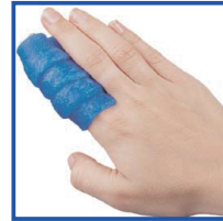
コールドバンデージ KLD0007の使用例