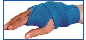
コールドバンデージ KLD0248の使用例