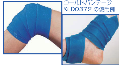
コールドバンデージ KLD0372の使用例