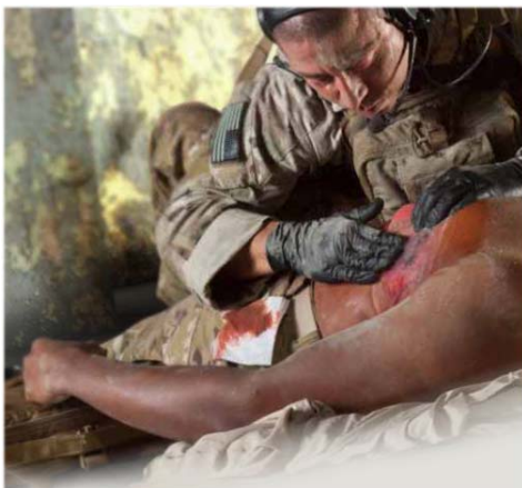
国土館大学・田中秀治教授監修

また、気胸の現場対処については、救急救命士は胸腔穿刺が出来ませんので、バルブ付きのチェストシールのみを使用してください。