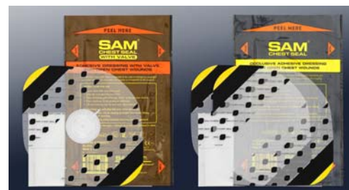
SAM62010 サムチェストシール バルブ付き