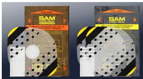
SAM62010 サムチェストシール バルヴ付き (救急現場処置用)

サムチェストシールは緊急時の救命救急用です 患者搬送中は常に装着していただき パッケージの内側は滅菌されています