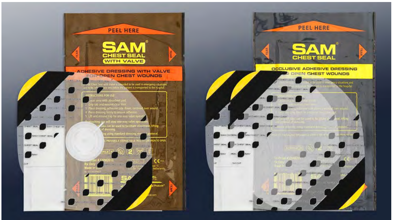
バルブ付き (1枚入り)

SAM チェストシールは、生命を脅かす緊張性気胸につながる 開放性気胸を処置するために開発された 強力な接着性を特徴とし、汗・血液・毛髪・砂が存在しても、 水中でも、皮膚に密着する バルブ付きは、胸腔からの呼気の脱気が可能な一方向弁が装着 されている