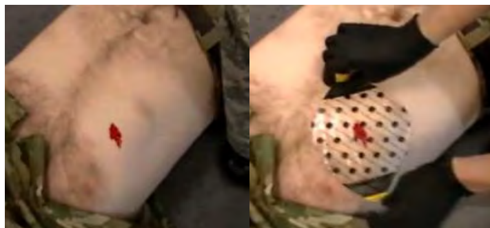
スタンダード (2枚入り)